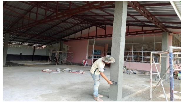
รูปภาพหลังดำเนินการปรับปรุง