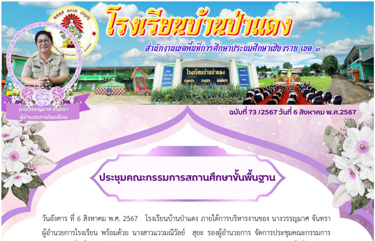
นางวรรณยุมาศ จันทรา ผู้อำนวยการโรงเรียน

ฉบับที่ 73 /2567 วันที่ 6 สิงหาคม พ.ศ.2567